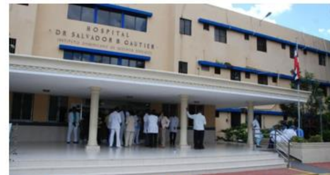
Entrada a Personal Medico en Hospitales