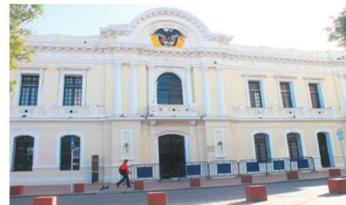
Entidades del Estado